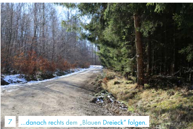
7 ...danach rechts dem „Blauen Dreieck“ folgen.