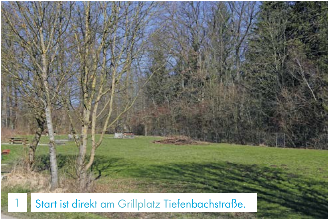
1 Start ist direkt am Grillplatz Tiefenbachstraße.