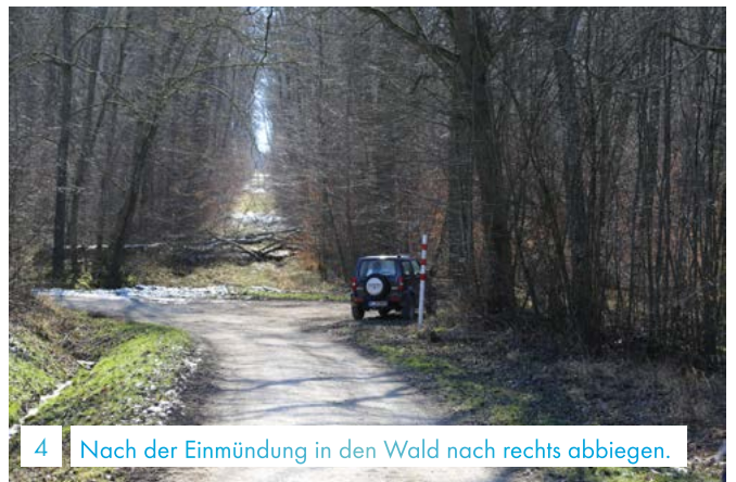
4 Nach der Einmündung in den Wald nach rechts abbiegen.