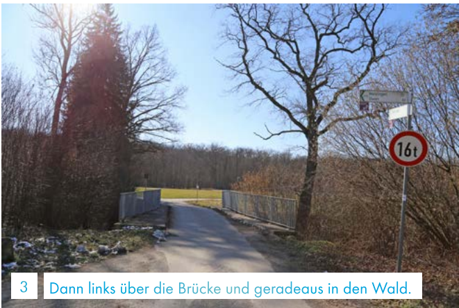
3 Dann links über die Brücke und geradeaus in den Wald.