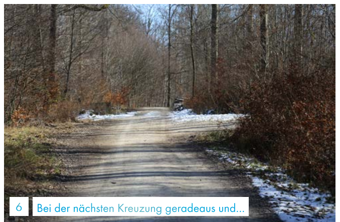
6 Bei der nächsten Kreuzung geradeaus und...