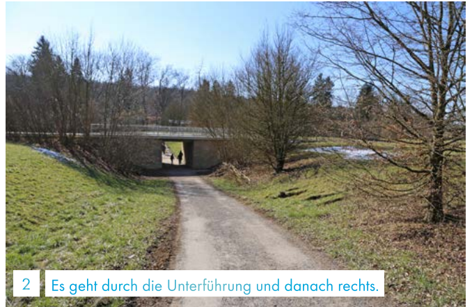
2 Es geht durch die Unterführung und danach rechts.