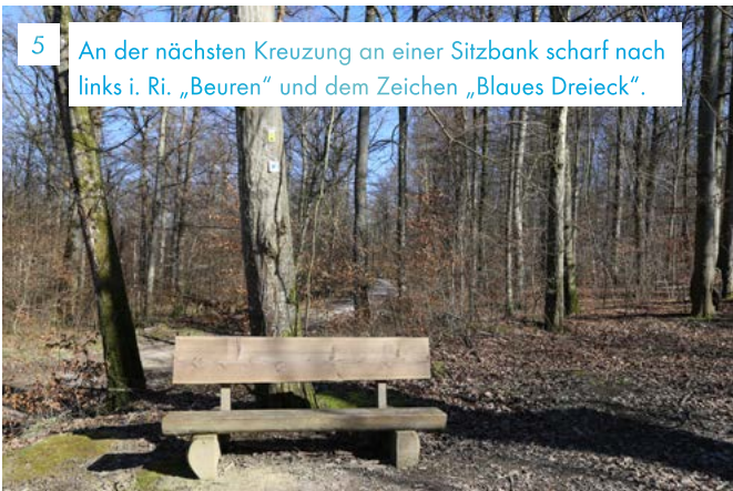
5 An der nächsten Kreuzung an einer Sitzbank scharf nach links i. Ri. „Beuren“ und dem Zeichen „Blaueres Dreieck“.